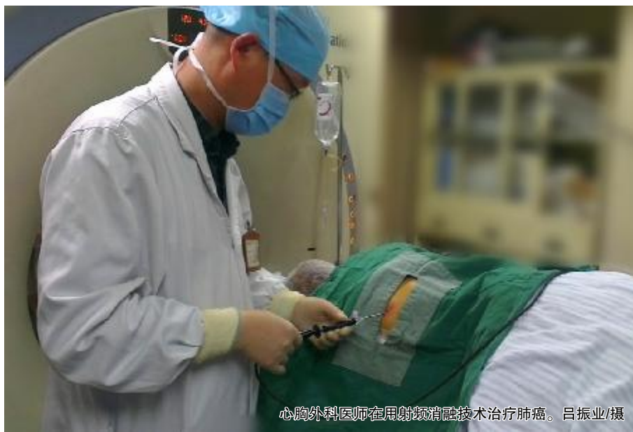
心胸外科医师在用射频消融技术治疗肺癌。

近日，我院心胸外科成功为一名肺癌晚期患者实施CT引导下射频消融术，这项技术在温州地区尚属首次开展，为肺癌患者开辟了一条综合治疗新途径。