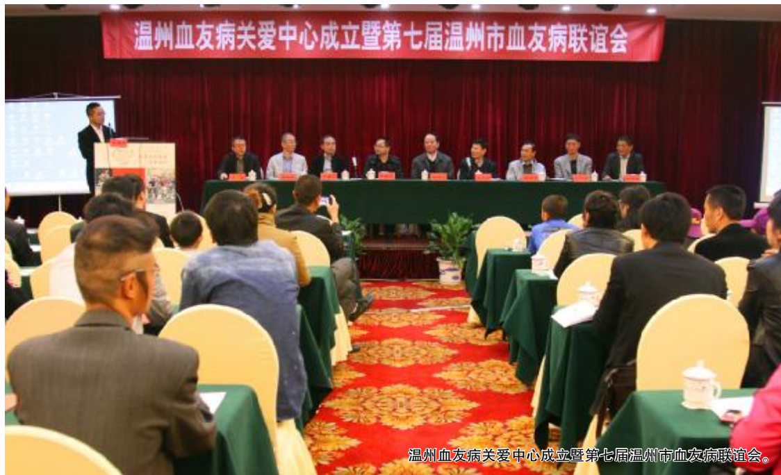
温州血友病关爱中心成立暨第七届温州市血友病联谊会。