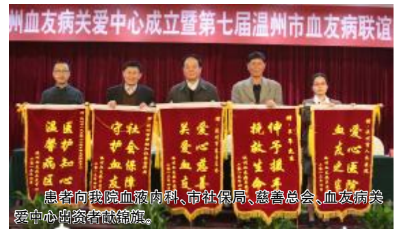
患者向我院血液内科、市社保局、慈善总会、血友病关爱中心出资者献锦旗。