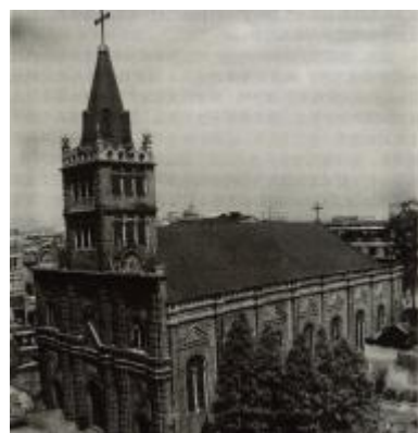
周宅祠巷天主教堂