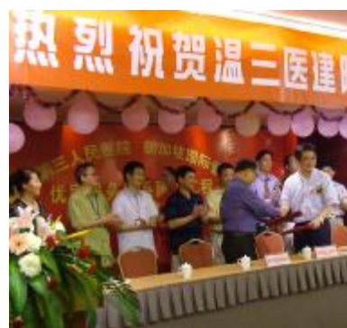
2008年9月与新加坡国际管理学院合作

一百年前,法国神父冯烈鸿及修女类斯以信仰之名,不远千里,远渡重洋来温州创办教会医院——当时称济病院,即为今日温州市人民医院的雏形。它在旧中国乱世飘摇期诞生,在新中国欣欣向荣期成长,在改革开放时期励精图治,于新世纪创新发展期壮大,温州市人民医院经历了一百年斑驳风雨的洗礼,逐渐成长为专家队伍雄厚、专业技术精良、学术成果丰硕的三级甲等综合性医院。回眸一个世纪的光变迁与沧桑砥砺,先驱者探索前行的空谷足音和庇佑百姓的医者仁心成为温州市人民医院所有员工永远的精神坐标。