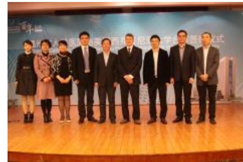
2013年4月与美国西弗吉尼亚大学合作