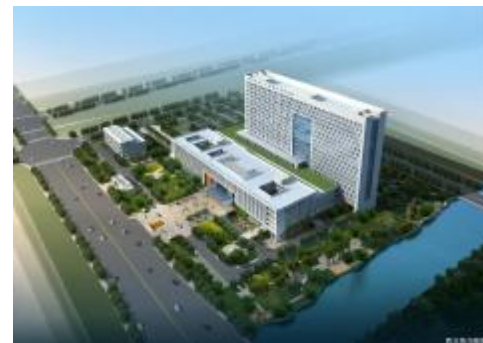
2012年12月温州市人民医院娄桥新院开工建设