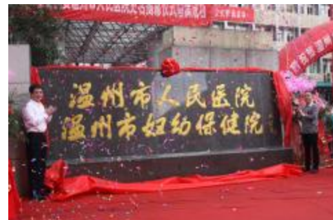
2012年6月更名为温州市人民医院