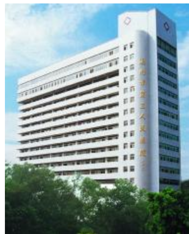
1999年10月住院大楼落成