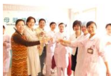
2008年1月母婴健康中心成立