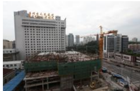
2010年12月温州市妇幼保健院综合大楼开工建设