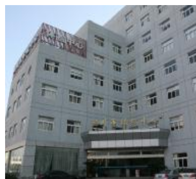
2005年6月温州市体检中心成立