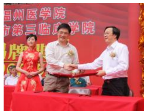
2009年5月成为温州医学院温州市第三临床学院

大鹏展翅鸣九皋,扶摇直上三千尺。温州市人民医院的美好蓝图已经绘就。总投资1.98亿元,建筑面积4.1万平方米的妇幼保健院综合大楼即将封顶;总投资6.8亿元,占地面积130亩,建筑面积12万平方米的娄桥新院区已开工建设。两者建成后,将极大改善医院就诊环境,提高医院服务能力,一个集温州市人民医院、温州市妇幼保健院及温州市健康管理中心为一体的现代化医疗集团将伫立于东海之滨。