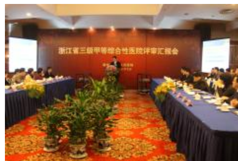
2012年1月被评为三级甲等综合性医院